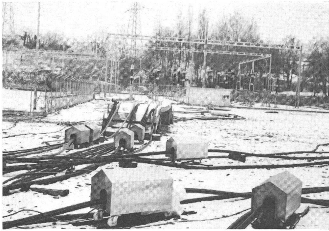
Fig. 3 Langzeitprüfungen in Verbois; Stromtransformatoren zum Heizen der Prüfkabel

Verkauf, Transport und Montage erstreckt. Erhöhte Prüfspannungen und verlängerte Prüfdauer bezwecken, Frühausfälle im Betrieb zu vermeiden, diese aber im Prüfstand zu erzwingen. Sind die vorgeschriebenen Typenprüfungen im Laboratorium erfüllt, so müssen Langzeitversuche an längeren Fabrikationsabschnitten durchgeführt werden, um die Qualität der Kabel nachzuweisen.