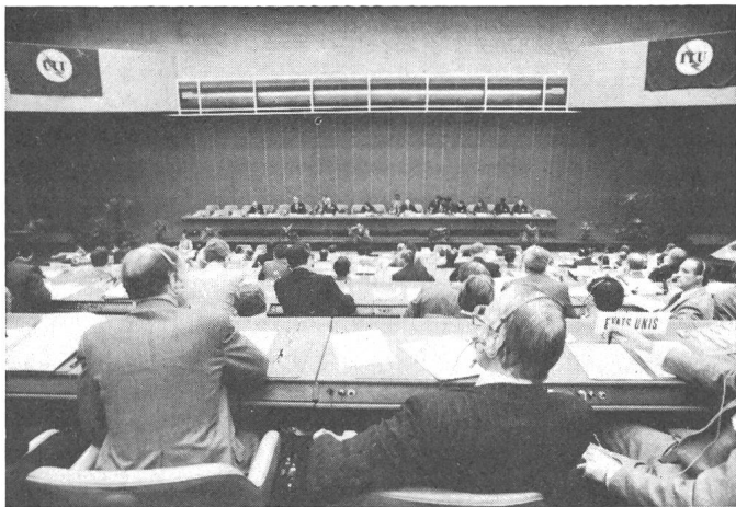
Fig. 2 Assemblée Plénière du CCITT à Genève en 1980

on les trouve aussi bien dans les Administrations où l'on établit les cahiers des charges et les règles de l'exploitation que dans les bureaux d'études des fabricants qui conçoivent les équipements. Les représentants des fabricants sont du reste admis à travailler dans les Commissions d'Etudes.