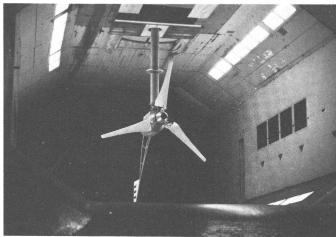
Fig. 1 Windenergiesystem im Windkanal des Eidg. Flugwerkes Emmen Rotordurchmesser 3,0 m

Vor der Wahl einer Windturbine oder der Ermittlung des Preises der erzeugten elektrischen Energie sollte darüber befunden werden, ob es sich bei der vorgesehenen Anwendung um eine geeignete Lösung handelt. Wenn z. B. die Stromerzeugung an einem abgelegenen Ort für den Tag- und Abendverbrauch vorgesehen ist und der grösste Teil der Windenergie zwischen 2 und 6 Uhr morgens anfällt, ist der praktische Nutzen einer Windenergieanlage in Frage gestellt, solange nicht