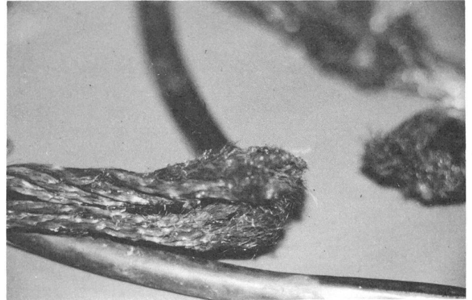
Fig. 3 Zustand einer defekten Erdungsgarnitur

abgerieben, und die Korrosion kann wieder angreifen. Da die Oberfläche der feindräftigen Litzen im Verhältnis zum Querschnitt sehr gross ist, erfolgt bald ein Bruch der einzelnen Teilleiter.