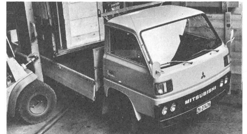
Canter. Mit 3,5 t und 5,5 t Gesamtgewicht, mit 2 Radständen, mit Benzin- oder Dieselmotor.

Mitsubishi Canter ab Fr. 22 990.- bis Fr. 28 290.-