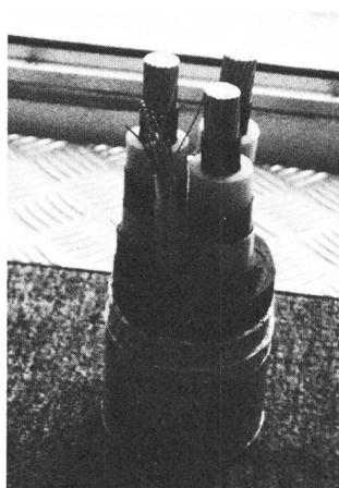
Fig. 1 Modell des verwendeten Seekabels

Als Besonderheit wurde ein Polymerkabel mit einem Schichtenmantel aus Aluminium über dem äusseren Halbleiter gewählt. In das Energiekabel ist zudem ein Steuerkabel mit einem Schichtenmantel eingesetzt für die Übertragung von Signalen und Steuerbefehlen (Fig. 1). Der Schichtenmantel wurde für dieses Seekabel ge-