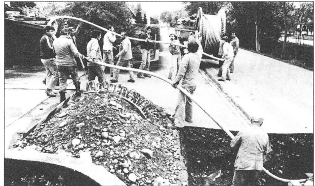
Alle ziehen am gleichen «Strick».

Um die zulässigen Grenzwerte mechanischer Belastung nicht zu überschreiten, war beim Verlegen ein grosser Personalaufwand nötig.