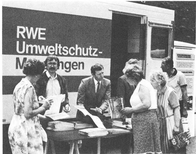
Fig. 3 Angeregte Diskussion bei einem Ausstellungsstand

Das RWE hat seine Informationszentren an den Kraftwerksstandorten mit interaktiven Exponaten ausgestattet, die die Besucher, die zum grossen Teil aus dem Ruhrgebiet anreisen, in besonderem Masse ansprechen, teilweise sogar zum «Spielen» einladen. Das Bild zeigt den Energieglobus, der die Energieversorgungslage der Länder dieser Erde, unterstützt durch Dias, darstellt.