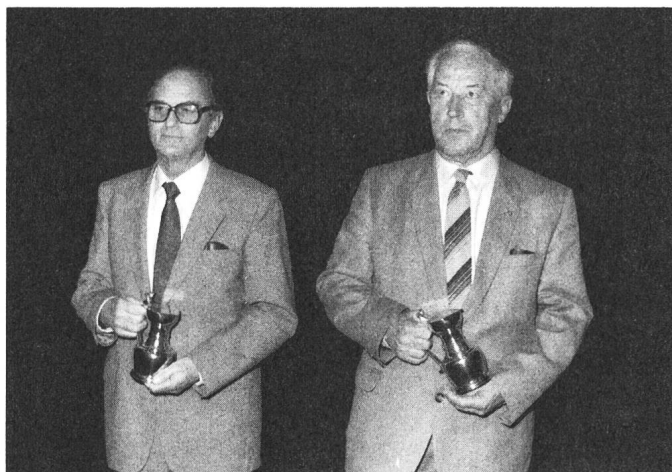
Glückwunsch für 50 Dienstjahre Remerciements pour 50 années de service