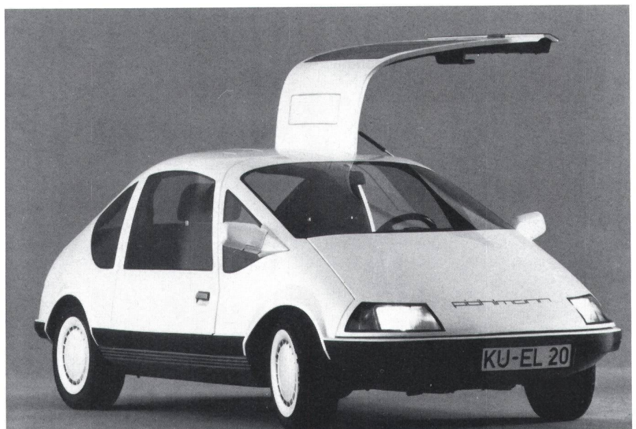
Fig. 1 Der Pöhlmann EL, ein 2+2-Sitzer mit Flügeltüren (wie der legendäre Mercedes 300 SL), Heckklappe, 125 km/h Spitze und 160 km Reichweite – das wohl gescheiteste Elektroauto, das jemals gebaut worden ist.

Wegen der ablehnenden Haltung der Automobilindustrie wird RWE diese Tochter, die Gesellschaft für Elektrischen Strassenverkehr (GES) in diesem Jahr auflösen. VW muss dann allein weitermachen oder den Elektro-Golf an den Nagel hängen. Den Pöhlmann EL hingegen, der in aller Stille in Pöhlmanns Kulmbacher Werkstatt entstand, kann man dort kaufen – und Mitte Februar hat die Stadt- und Kreissparkasse Kulmbach das erste «handgezimmerte»