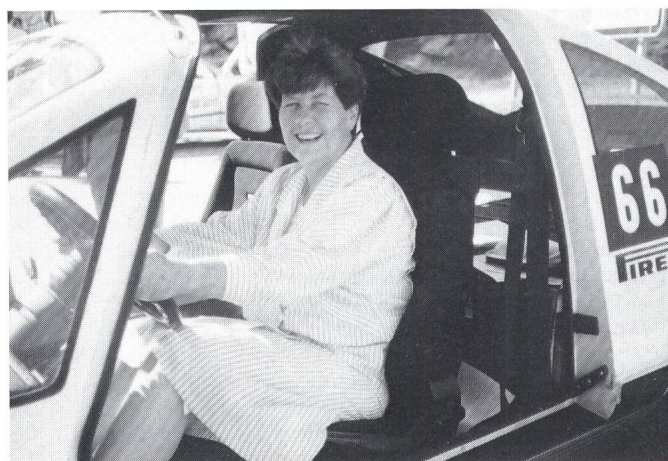
Standespräsidentin Derungs am Steuer eines Pöhlmann EL

Am Rande der INFEL-Mitgliederversammlung wurden verschiedene Elektroautos ausgestellt, unter anderem ein Pöhlmann EL, ein Elestra aus Strassburg, ein Mowag «Pendler», ein Transporter der Fa. Klingler sowie der City-Stromer der Elektra Birseck sowie der von der INFEL ausleihbare City-Stromer. Die Besucher hatten auch die Gelegenheit, auf kurzen Probefahrten die ausgestellten Elektroautos näher kennenzulernen. Ein Stand der ASVER (Schweizerischer Verband für Elektrische Strassenfahrzeuge) orientierte ferner über die Aktivitäten dieser noch jungen Organisation.