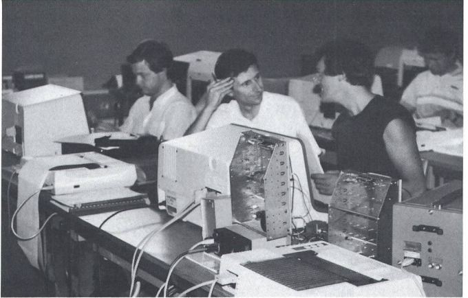
Fig. 3 Labor einst und jetzt Links: Messungen mit Thomson-Brücke