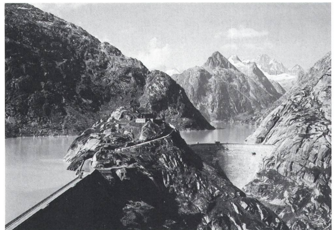
Fig. 2 Die heutige Stauanlage Grimsel

Leistung Wasser von Grimsel-West nach Gelmer zu verschieben.