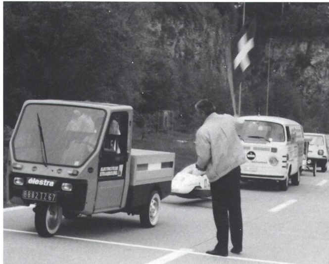
Auch 1987: Start frei für einen Grand Prix Formel E

Nähere Auskunft über diesen international ausgeschriebenen Grand-Prix erteilt der ACS, Wasserwerksgasse 39, 3000 Bern 13. Anmeldeschluss ist der 30. April 1987. ACS