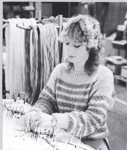
Herstellung von Kabelsätzen

Die Max Hauri AG besitzt die Generalvertretung für die Schweiz von namhaften europäischen Herstellern. Das Verkaufsprogramm umfasst über 5000 Artikel vorab für die Installationstechnik, insbesondere für die Beleuchtung. Wer weiss schon, dass die Weihnachtsbeleuchtung der Zürcher Bahnhofstrasse ein Werk der Firma Max