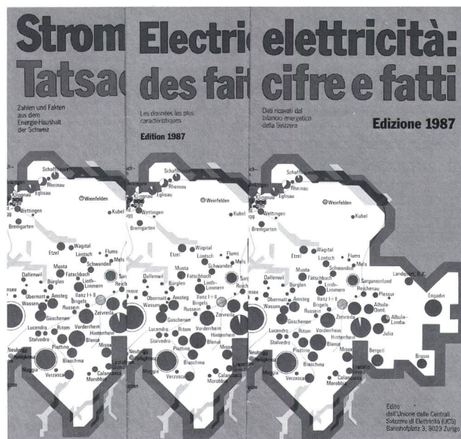
Stromtatsachen: Wissenswertes in drei Sprachen.

Daneben werden Zahlen und Fakten aus dem Energiehaushalt der Schweiz, visualisiert durch zahlreiche übersichtliche Tabellen und Illustrationen, präsentiert. Aktuelle Themen wie «Fernwärme aus Kraftwerken» oder «Schweizerischer Stromtausch mit dem Ausland im Winterhalbjahr» werden knapp, aber anschaulich behandelt. Dieses vom VSE herausgegebene, hilfreiche Informationsmittel kann bei den Elektrizitätswerken bezogen werden. Es