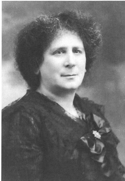
Figur 8 Hertha Ayrton (1854–1923)

Seit dem Tod von Hertha Ayrton , 1923, hat sich kaum eine Frau mehr erfolgreich mit der elektrischen Materie