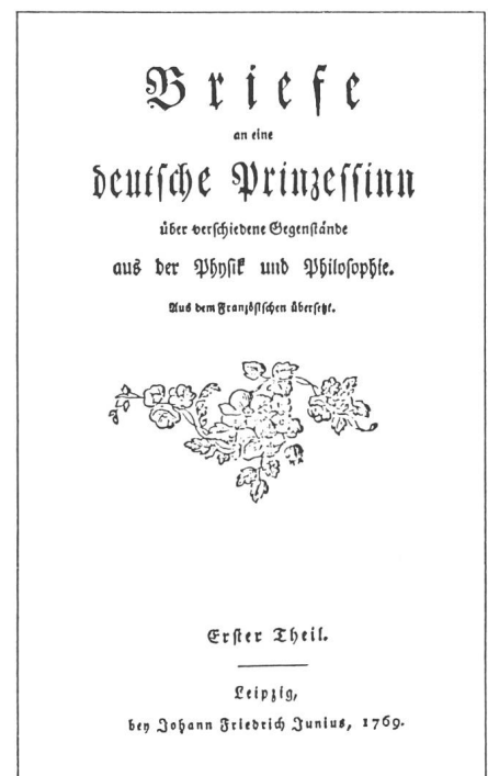
Figur 2 Leonhard Eulers «Briefe an eine deutsche Prinzessin», 1769

L. Euler war nicht nur Mathematiker, er beschäftigte sich vielmehr auch intensiv mit Physik [10]. Sein Hauptwerk über die Naturphilosophie trägt allerdings einen ungewöhnlichen Titel: «Briefe an eine deutsche Prinzessin über verschiedene Gegenstände aus der Physik und Philosophie» (Fig. 2). Friedericke Charlotte , Tochter des Markgrafen Friedrich von Brandenburg-Schwedt , wurde seit ihrem fünfzehnten Lebensjahr, 1759, von Euler unterrichtet. Die Briefe entstanden zwischen 1760 und 1762 und handeln