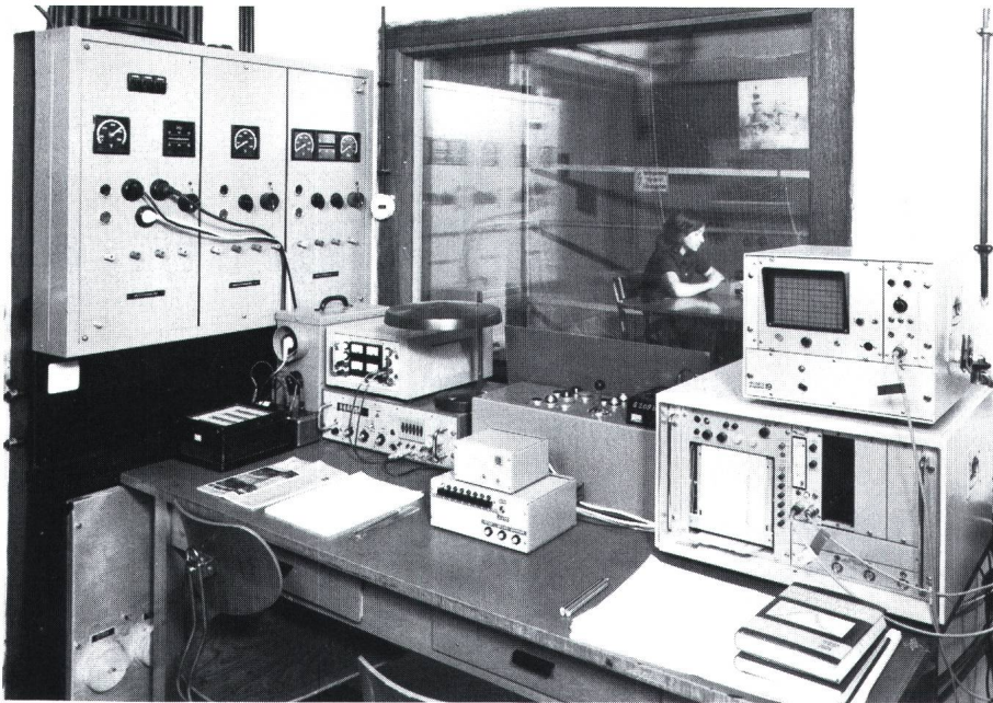
Figur 3 Mess- und Steuereinrichtung

ke von 20 kV/m erweitert. Die Versuchsgruppen wurden bei einer Expositionszeit von fünf Stunden vergrößert und das Untersuchungsprogramm ausgedehnt auf das Verhalten der Elektrolyte des intermediären Stoffwechsels und der wichtigsten Hormone zur Beurteilung von Stressreaktionen. Auch hier zeigten sich keine signifikanten Unterschiede zwischen den Exponierten und den Vergleichsgruppen, insbesondere ergab sich kein Anhalt für Stressreaktionen.