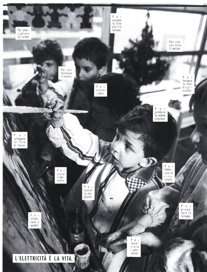
Le aziende elettriche svizzere contribuiscono ad assicurare il futuro della gioventù, fornendo un'energia pulita. Per mantenere il consumo di elettricità entro limiti ragionevoli, abbiamo pubblicato l'opuscolo «Elettricità: evitiamo lo spreco!» da richiedere gratis al 01/211 03 551, o chi lo legge risulterà felice dare il buon esempio ai bambini nell'evitare gli sprechi di energia.

ist 1988 mit diesem Resultat ein weit überdurchschnittlicher Wert für die Aufmerksamkeitswirkung erreicht worden.