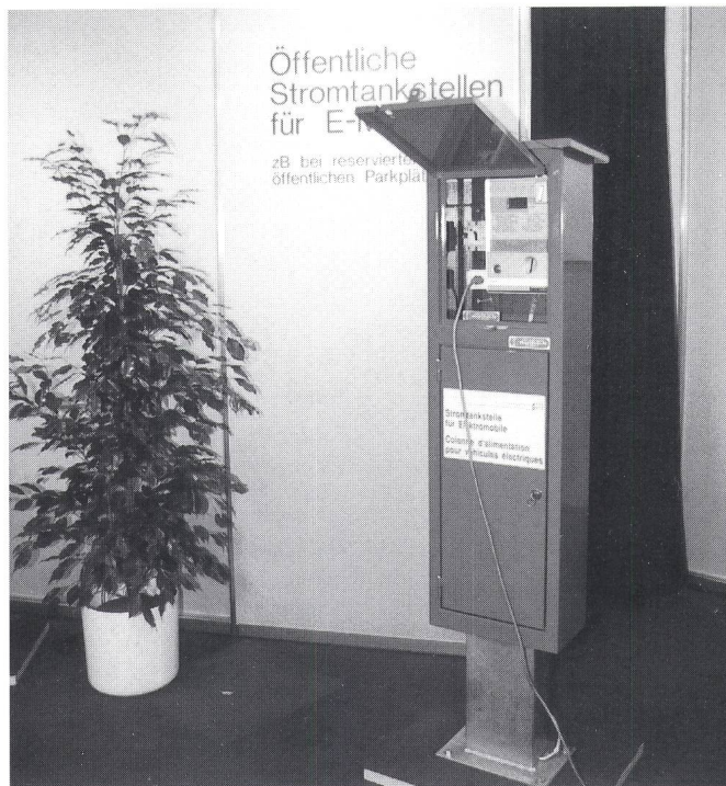
Am 2. Solarmobilsalon in Basel stellte der VSE eine von ihm entwickelte «Stromtankstelle» für Elektromobile vor.

Les colonnes d'alimentation sont équipées d'un compteur à prépaiement et d'un compteur d'électricité étalonné ainsi que des coupe-circuit et disjoncteurs nécessaires. Branchées sur une prise de courant normale (220 V), les batteries du véhicule se rechargent après introduction de la monnaie dans le compteur. La colonne d'alimentation peut aisément être utilisée dans des parcs de sta-