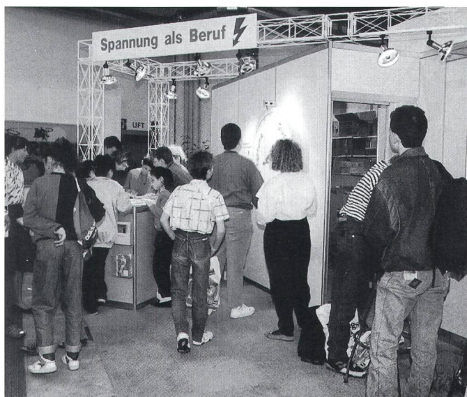
Bei einem Wettbewerb konnten attraktive Preise gewonnen werden. Des prix intéressants ont pouraient être gagnés lors d’un concours.

«La tension comme profession» – tel a été le slogan du stand commun de l’Union Suisse des Installateurs-Electriciens (USIE) et l’Union des Centrales Suisses d’Electricité (UCS) dans le secteur Ta profession – ton avenir à la foire aux échantillons (MUBA) de Bâle. Le stand avait pour but de faire mieux connaître les trois professions de monteur-électricien, dessinateur d’installations électriques et électricien de réseau. On pouvait y voir la démonstration de travaux pratiques, la présentation d’une place de travail CAD avec traceur, des tests de protection des personnes et contre les incendies ainsi qu’un film vidéo. La véritable attraction a toutefois été le poteau installé dans la salle d’exposition, poteau sur lequel tous les jeunes courageux, aussi bien filles que garçons, ont pu faire preuve de leurs talents d’escaladeurs. La roue de la Fortune était une autre attraction. Pour avoir une fois la possibilité de la faire tourner et gagner ainsi, avec un peu de chance, des prix intéressants, les intéressés ont d’abord dû répondre correctement aux six questions du concours. Pas moins de 5 000 participants ont tenté leur chance à ce concours en répondant aux questions sur les principales ac-