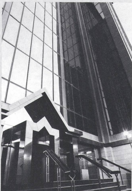
Eingang zum 15stöckigen Bürogebäude 3 am South Quay Plaza

Dieser Bauabschnitt ist Teil der bedeutendsten Stadtteilsanierung Europas. Das 21 km 2 grosse Areal liegt auf