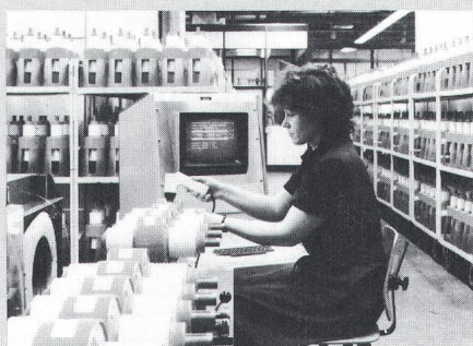
Serienfertigung von Vakuumschaltröhren bei Siemens

In einen Leistungsschalter für die Bayer AG Leverkusen wurde die 250 000. Vakuumschaltröhre von Siemens eingebaut, die kürzlich in Berlin