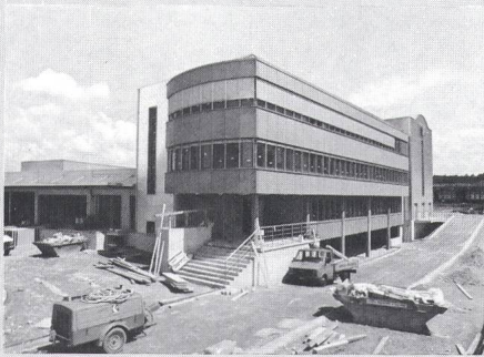
Das neue JF-Haus in Volketswil

ma, für einen Ausbau der Dienstleistungen, für erweiterte Lieferbereitschaft. Die neue Postadresse lautet: Postfach, 8603 Schwerzenbach. Tel. 01/946 00 22, Fax 01/946 00 44.