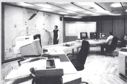
Kommandoraum der neuen Netzleitstelle

Anlässlich einer Presseorientierung hat kürzlich die S.A. l'Energie de l'Ouest Suisse (EOS), Lausanne, die neue Netzleitstelle offiziell dem Betrieb übergeben. Die neue Telegyr-Anlage von Landis & Gyr ersetzt alle bisherigen Installationen. Im November vergangenen Jahres wurde die alte Netzleitstelle ausser Betrieb gesetzt, und bereits innerhalb von fünf Stunden funktionierte danach die Kommunikation mit den über 50 Unterstellen wieder einwandfrei. Die Feuertaufe erlebte die neue Netzleitstelle schliesslich am 27. Februar, als orkanartige Stürme über die ganze Schweiz hinwegfegten: Innerhalb weniger Minuten wurde die Netzleitstelle mit Alarmmeldungen überschüttet, da der Sturm innerhalb kurzer Zeit allein im Versorgungsgebiet der EOS zu mehr als 60 Leitungsunterbrüchen führte.