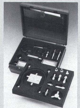
Messzubehör für SNA

Die Messbrücken RFZ-1 (bis 180 MHz) und RFZ-6 (bis 3,2 GHz) ermöglichen Reflexionsmessungen in Verbindung mit den Spektrum- und Netzwerkanalysatoren SNA-2, SNA-3 und SNA-6. Grunddämpfung