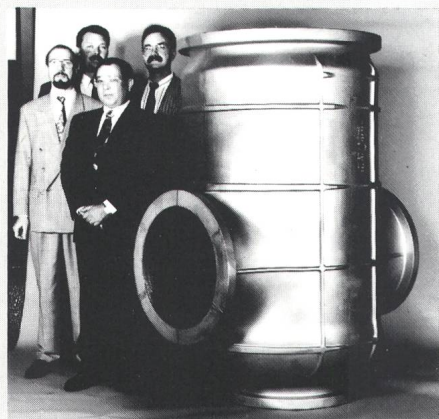
Weltgrösstes SF 6 -Schalter-Gehäuse

Für einen 600...800-kV-Schalter fertigt die Aluminium AG Menziken das weltgrösste SF 6 -Gehäuse. Mit dem 420 Kilogramm schweren Aluminium-SF 6 -Gussteil erschliesst die Giesserei neue Dimensionen. Zur Fertigung des 2 Meter hohen Gussteils werden 16 Tonnen Formsand verar-