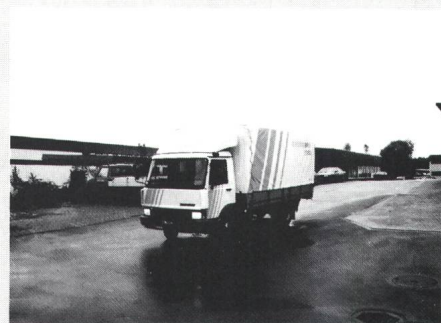
Anlieferungskonzept erlaubt optimalen Einsatz der Monteure

Mit einem auf die Kundenbedürfnisse zugeschnittenen Auslieferungskonzept und arbeitssparenden Bestellmöglichkeiten intensiviert der Lichttechnik-Spezialist Zumtobel AG, Rümlang, seinen Kundenservice. Seit Oktober letzten Jahres werden die Kunden, hauptsächlich Elektroinstallationsfirmen, wöchentlich mit 28 Fahrten bedient. Die Zustellungen erfolgen nach einem vorbestimmten Turnusplan, über den der Kunde informiert wird. Die Fahrzeuge von Zumtobel verfügen über Autotelefon, um die Lieferungen nach Wunsch zu avisieren oder kurzfristige Aufträge erledigen zu können. Schliesslich reagierte das Unternehmen auf die zunehmende Verbreitung der Telefax-Geräte mit einem fax-gerechten Bestellformular, welches erlaubt, den Bestellvorgang noch weiter zu verkürzen.