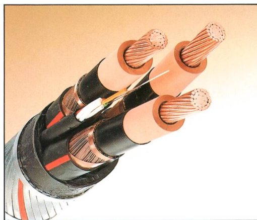
Câble moyenne tension de 20 kV, avec câble à fibres optiques incorporé pour la transmission de données.

Ces câbles d'énergie, indispensables à notre vie, COSSONAY les fabrique.