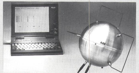
Ausrüstung für EM-Feldstärkemessung 75 kHz...30 MHz

Im Auftrag der PTT in Bern hat das EMI-Control Center der Asea Brown Boveri AG (ABB) in Baden-Dättwil, Schweiz, die Grundlagen in Theorie und Praxis für ein neues Messgerät für elektromagnetische Felder erarbeitet. Das Feldstärkemessgerät, welches gleichzeitig elektrische und magnetische Felder im Bereich von Rundfunksendern erfasst, soll genaue Auskunft über die tatsächliche Einwirkung von elektromagnetischer Strahlung auf den Menschen geben. Mit nur