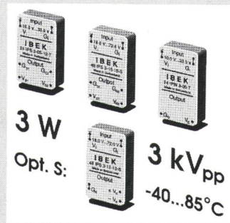
3 W/3 kVpp DC-DC-Konverter

Gehäuse mit einer Höhe von nur 10,5 mm mehr als hundert verschiedene Standardtypen. Die