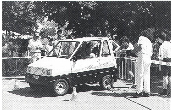
Beim Geschicklichkeitsfahren kam es auf den Zentimeter an

Den Abschluss bildete jeweils ein Wettrennen mit ferngesteuerten Modell-Solarmobilflitzern, das vor allem Jugendliche, aber auch jung gebliebene aller Altersklassen in seinen Bann zog. Ganz erstaunlich war die Vielfalt der selbstgebastelten Karosseriekonstruktionen, die aus dem jeweils gleichen Bausatz gestaltet worden waren. Die Gewinner erhielten schöne Pokale. Zusätzlich wurden Sonderpreise für ein besonders gelungenes Design der Modellfahrzeuge vergeben, die von der Informationsstelle für Elektrizitätsanwendung (Infel) gestiftet worden waren. Ps