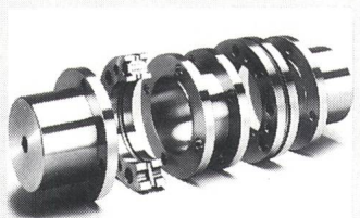
Drehsteife und flexible Kupplung

Aufgrund der besonderen Anordnung von Lamellen, Flanschen, Schrauben und Unterlagscheiben gleichen die flexiblen BSD-Thomas-Kupplungen alle auftretenden Verlagerungen aus, sind dabei jedoch in Umfangs-