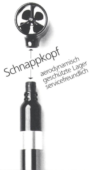
Flügelrad-Anemometer zum Aufstecken

Die Korrektur der Messresultate wegen Druck- und Temperaturveränderungen des Mediums können vernachlässigt werden. Die aerodynamische Fühlerform erlaubt eine Abweichung zur Strömungsrichtung von \pm 25 Winkelgraden. Der durch Abnutzung oder Beschädigung des Flügelrades bestehende Nachteil dieser Messmethode wird durch das Schnappkopf-Prinzip von Schiltknecht behoben. Ein be-