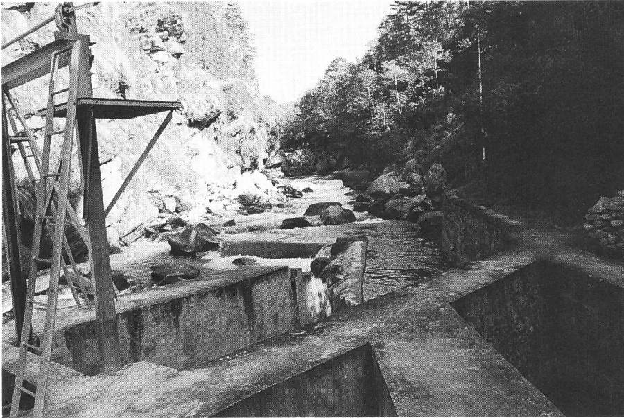
Bild 5 Die Wasserfassung im Solu Khola rund 450 m oberhalb des Kraftwerks liefert auch bei Niedrigwasser (Bild) genügend «Betriebsstoff» für zwei Maschinen, ohne dass dadurch ein Restwasserproblem entsteht. Umgekehrt ist sie so ausgelegt, dass sie dem wildbachähnlichen Regime (5–400 m 3 /s) standzuhalten vermag

den ländlichen Regionen aus, wo 94% der nepalischen Bevölkerung leben, aber nur 2% davon an eine Stromversorgung angeschlossen sind. Nicht zuletzt wegen ihrer Unwegsbarkeit könnten diese Gebiete aber nur mit grösstem Aufwand zentral elektrifiziert werden.