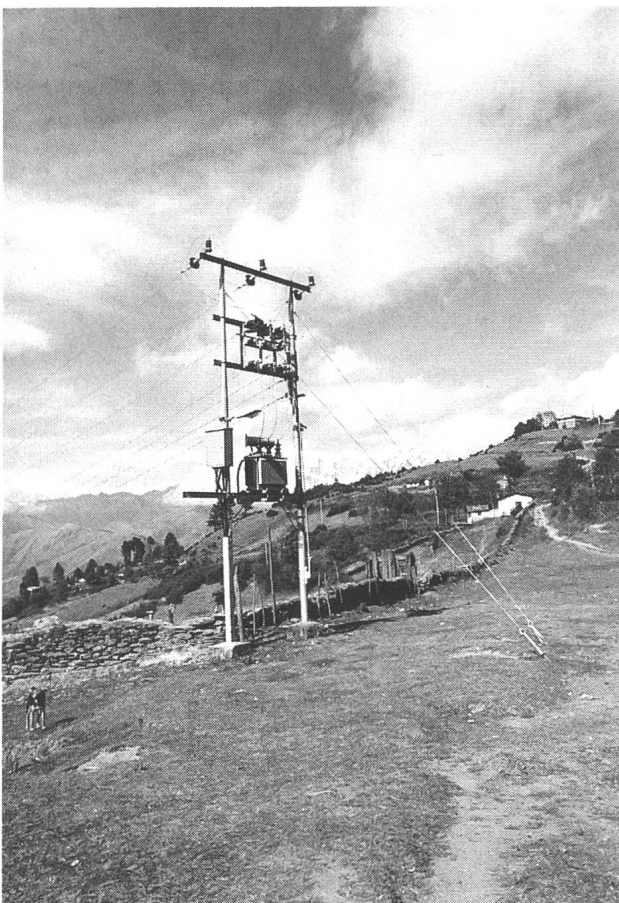
Bild 9 Das Ende einer der drei vom Werk ausgehenden 11-kV-Stichleitungen mit Trennschalter und Freilufttrafo, hier in Chialsa auf fast 3000 m Höhe

Ausgangspunkt für die Tarifgestaltung bildeten die zuvor beschriebenen einzelnen Leistungsstufen, die in Kombination mit den differenzierten Arbeitspreisen (siehe Tabelle) auf die unterschiedlichen Bedürfnisse und Möglichkeiten zugeschnitten sind und auf diese Weise das erwünschte Verbraucherverhalten fördern. Stufe 1 und 2 bezahlen nur eine Grundgebühr von monatlich 41 bzw. 156 Rupien (30 Rupien entsprechen ungefähr Fr. 1.–), aber keinen Arbeitspreis. Das erspart bereits den Zähler (chinesische, durchaus