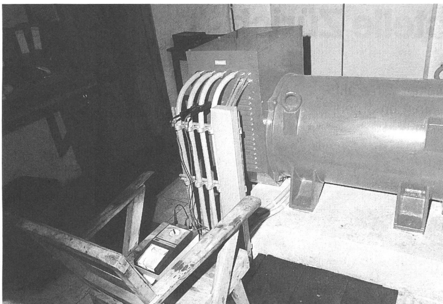
Bild 3 Es geht auch mal ohne Schweizer Perfektionismus: Provisorium zur Aufzeichnung der Lastkurve mit einem einfachen Registriergerät und Stromzange an einer der drei Generator- Phasen

Denn ein Kraftwerk allein für die Teppich-Manufaktur zu bauen, wäre trotz deren relativ hoher, aber nur tage- weise benötigten Anschlussleistung