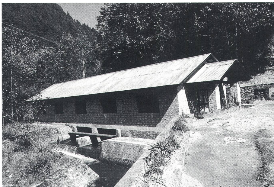
Bild 1 Das Kraftwerk im Tal des Solu Khola. Zurzeit ist erst eine Maschineneinheit mit einer installierten Leistung von 180 kW in Betrieb