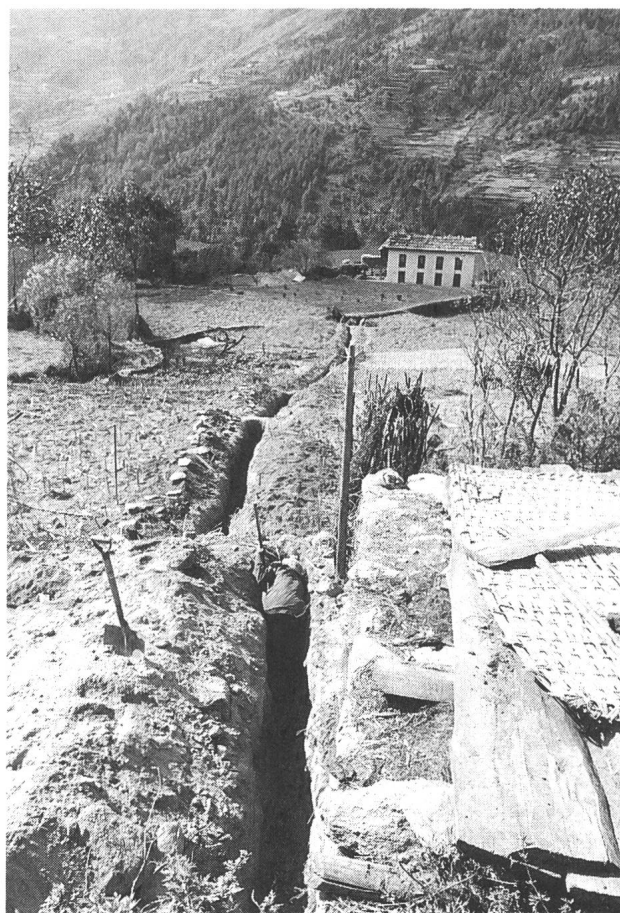
Bild 7 Die Verkabelung des Niederspannungsnetzes erfolgt ausschliesslich in Handarbeit

nium) gewählt. Das hat indessen nichts mit schweizerischem Perfektionsdrang und auch nicht allzuviel mit Heimatschutzdenken zu tun, sondern dient vor allem der Sicherheit: Zum einen ist das Netz auf diese Weise vor Wind und Wetter (Monsun) und damit gleichzeitig vor atmosphärischen Einflüssen geschützt, zum anderen aber gleichzeitig – in Entwicklungsländern meist ein Problem – vor (mitunter lebensgefährlichem) Stromdiebstahl.