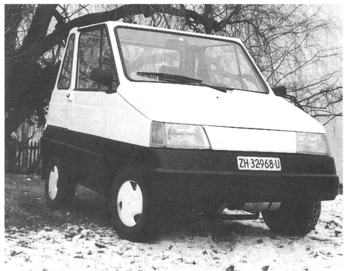
«Puli City»: so heisst das verbesserte Nachfolgemodell des Euromobils Pinguin 4 aus Ungarn

Am Informationsstand der Asver wird ein Wettbewerb durchgeführt, bei dem die Besucher ihre Vorstellungen vom Elektroauto der Zukunft anmelden können und gleichzeitig die Chance ha-