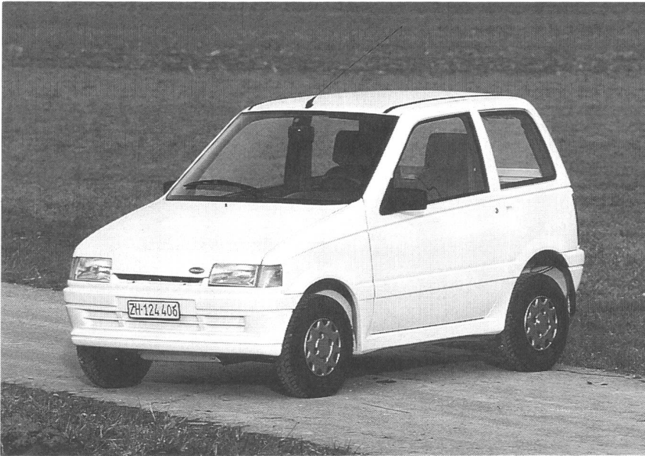
Der neue Microcar «Light!»: Kombiniert Reihenschlussmotor mit NiCd-Batterien (die auch geleast werden können)

Ohne bereits eine bestimmte Richtung für die ökologischen Bemühungen des Automobilbaus festzulegen, soll die Ausstellung der Öffentlichkeit eine der möglichen Lösungen aufzeigen, an der derzeit intensiv gearbeitet wird.