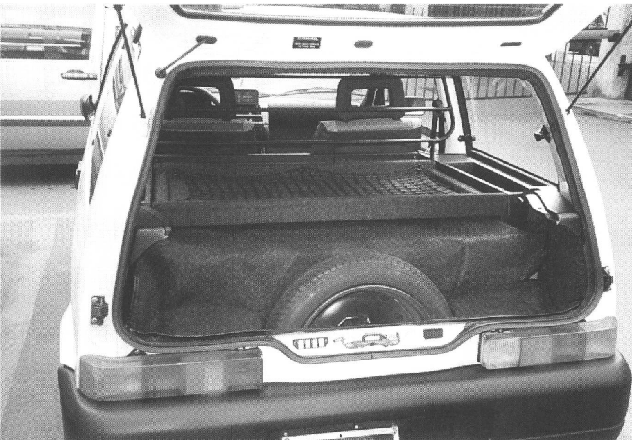
Die Batterien brauchen viel Platz im Cinquecento «Elettra»