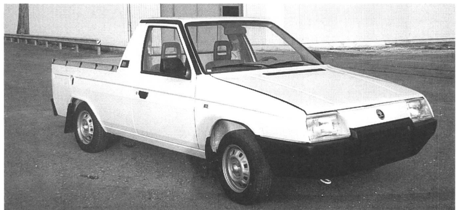
Skoda «Pick-up E»