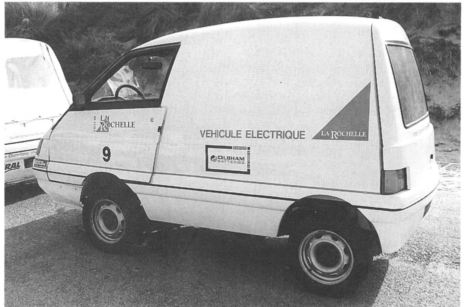
Der Volta aus La Rochelle (F): nun auch in der Schweiz erhältlich