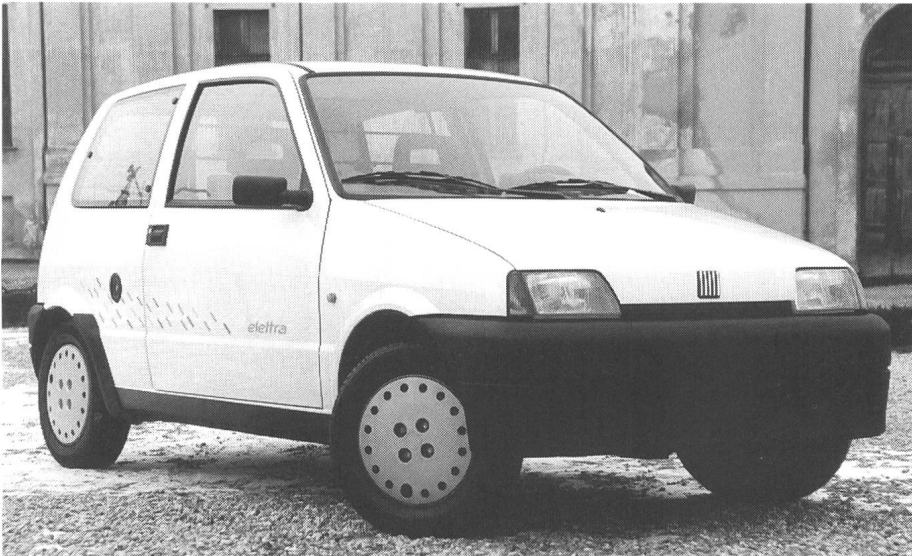
Der neue Fiat Cinquecento, von Anfang an auch als «Elettra» erhältlich