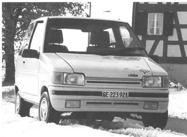
Der neue Ligier «Optima Sun»: Kleinstauto aus Frankreich mit Asynchronantrieb aus Genf

Die grossen Automobilfirmen, die traditionsgemäss innerhalb der Mauern der Palexpo zuhause sind, wurden ebenfalls eingeladen, ihre Elektro- oder Solarmobil-Entwicklungen im Rahmen dieser Sonderschau zu präsentieren. Die Bezeichnung dieser Ausstellung wurde bewusst gewählt: Prototypenentwicklungen mit anderen Lösungen zur Reduktion des Energiebedarfs und der Schadstoffemissionen werden weiterhin am jeweiligen Hauptstand der Firma präsentiert.