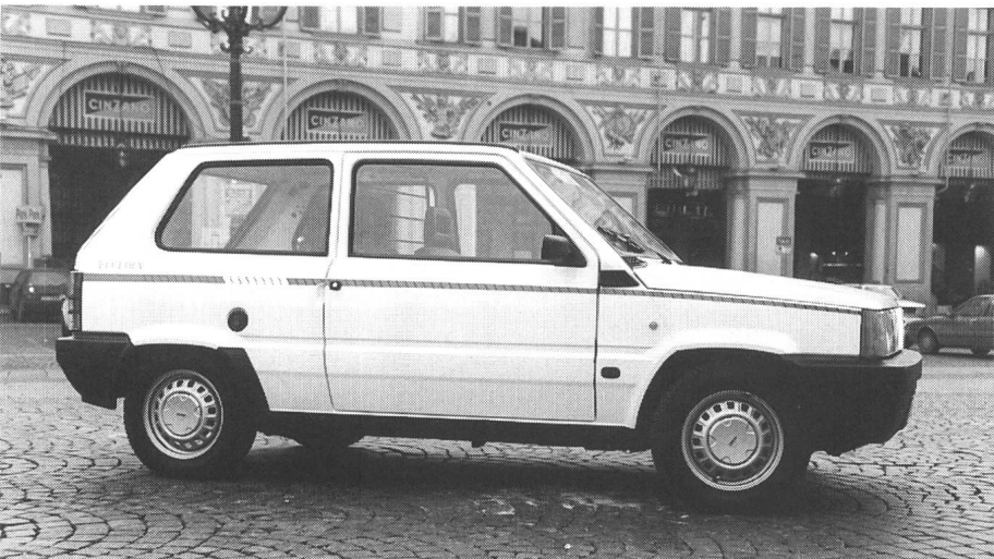
Fiat Panda «Elettra»: Rund 400 Fahrzeuge im Einsatz

Der Preis des Microcar «Light!» ohne Batterien wird voraussichtlich bei sFr. 22 535.– liegen, für die Batterien sind noch einmal sFr. 8800.– aufzuwenden, dafür erhält der Käufer jedoch eine 4-Jahres-Garantie auf die Batterie. Wer will kann – eine Neuheit – die Batterie auch leasen; der monatliche Preis dafür beträgt dann – bei vier Jahren Laufzeit – sFr. 226.–.