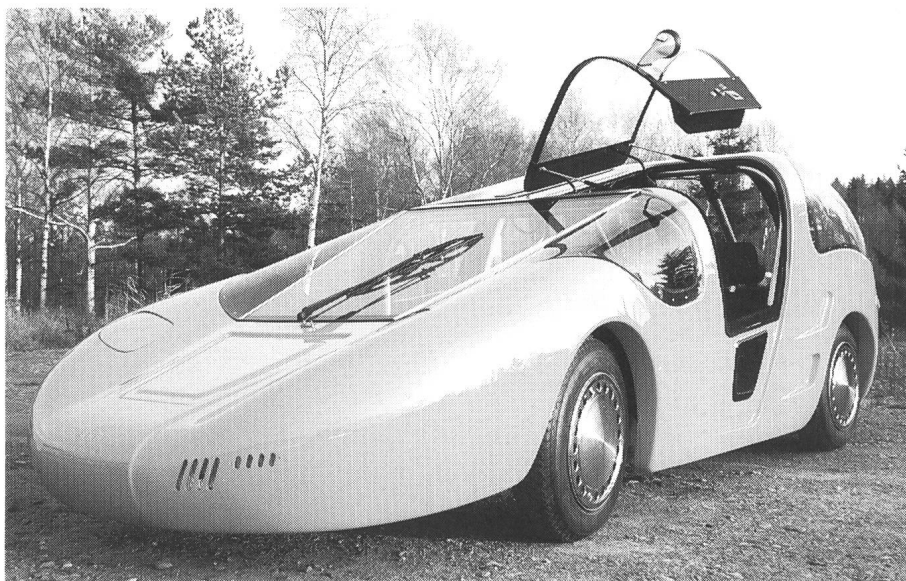
Rassige Prototypen aus Schweden (oben) und der Schweiz (unten)

Schwerpunkt des Gemeinschaftsstandes der Genfer Firma Scholl Sun Power und der französischen Automobilfirma Ligier bildet der neue «Optima», der – unter Verwendung von verschiedenen Antriebskomponenten aus Genf – nun vollständig in Frankreich produziert wird. Das mit einem von Scholl entwickelten Asynchronantrieb ausgerüstete Fahrzeug weist mit rund