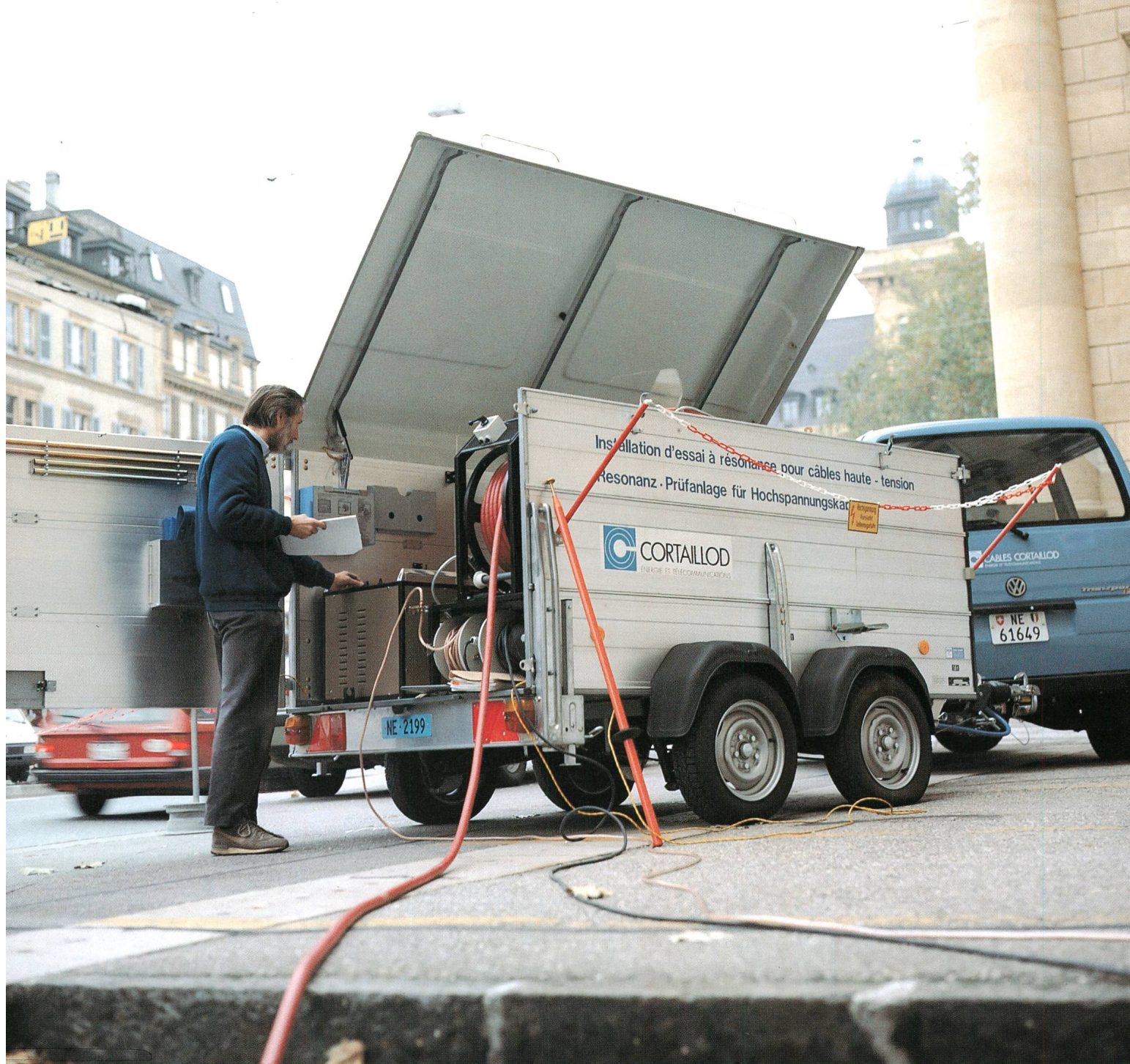
Installation à résonance pour le diagnostic sur site de câbles MT jusqu'à 36 kV.