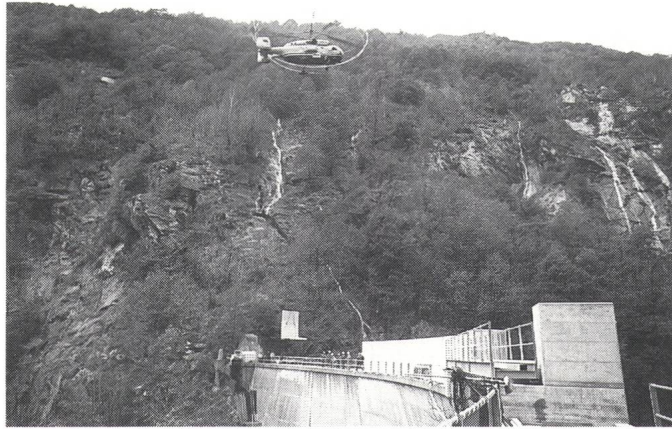
Bild: Abliegung eines der 35 L-förmigen Elemente (4,3 Tonnen) auf der Krone der Staumauer Vasasca Foto: Posa di uno dei 35 elementi a «L» del peso di circa 4,3 t sulla corona della diga Vasasca