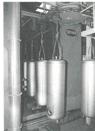
Umweltfreundliches Sandstrahlen, statt Verwendung von Säure- und Laugenbäder

Im Hinblick auf einen umweltfreundlichen Betrieb und eine weitgehende Rezyklierbarkeit am Lebensende konnten bei der neuen Generation von Wassererwärmern die folgenden Merkmale realisiert werden: Die Geräte sind mit wenigen Handgriffen in die einzelnen Teile zerlegbar (einschliesslich Verschalung und Isolation). Für den Benutzer heisst das, dass auch jedes Teil des Gerätes einzeln ersetzt werden kann, und dass sich so bei einem Reparaturfall der Aufwand auf ein Minimum beschränkt. Für die einzelnen Komponenten wie zum Beispiel Isolation, Innenkessel, Verschalung, Heizkörper usw. ist eine hundertprozentige Wiederverwertung gewährleistet. Der Hersteller selbst ist für den Wiederverwertungsprozess eingerichtet. Das Isolationsmaterial ausgedienter Geräte beispielsweise wird er mechanisch zerkleinert und bis zu achtmal für neue Formteile wiederverwendet.