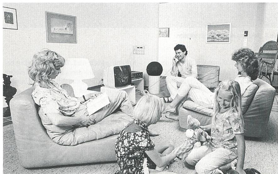
Bild 1 Die Verantwortung für den Stromverbrauch liegt beim Kunden. 1991 stieg zum Beispiel der Stromverbrauch in den Schweizer Haushalten um fast 5%

Hier muss die Elektrizitätswirtschaft Flagge zeigen, und sie tut dies in ausgesprochen engagierter Art. Sie hat das Bekenntnis abgelegt, sich für die Stabilisierung einzusetzen und daraufhin einen umfangreichen Massnahmen-Katalog erarbeitet. Selbstverständ-