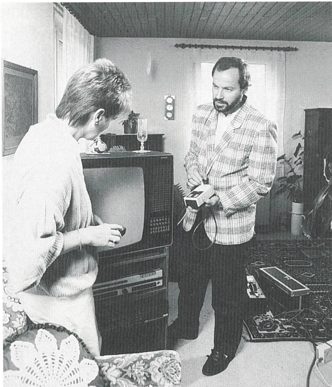
Bild 2 Elektrizitätswerke engagieren sich beim Stromsparen: Hier ein Stromsparberater auf Hausbesuch

Jahren wurden deshalb in der Schweiz 50 professionelle Beratungsstellen aufgebaut, die jedem Kunden zur Verfügung stehen und diesem in der Regel neben Einsparung der Kilowattstunden auch noch eine Entlastung des Portemonnaies ermöglichen. Weiter werden Ausstellungen und Kurse im Bereich «Rationelle Stromanwendungen – Stromsparen» durchgeführt. Für Dienstleistungsbetriebe und Gewerbe werden vielerorts gratis Grobanalysen und Messungen vorgenommen, damit der Kunde entscheiden kann, wo er Möglichkeiten hat, seinen Verbrauch zu reduzieren. Es werden Wartungskontrollen bei Warmwasser-Boilern oder bei Elektro-Heizungen durchgeführt und es werden Ausbildungsveranstaltungen für Hauswarte und Mitarbeiter von Gemeindeverwaltungen angeboten. Ferner werden Beleuchtungssysteme untersucht und optimiert, um nur einige Beispiele zu nennen.