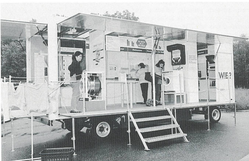
Bild 3 Beratung im mobilen Waschsalon

Parallel zu all diesen Möglichkeiten und vielen weiteren kleinen Schritten hat die Elektrizitätswirtschaft etwa 20 Aktionen vorbereitet, die zurzeit regional getestet werden. So will man Entscheidungsgrundlagen für eine allfällige landesweite Umsetzung erhalten. Diese Aktionen sollen also, wenn sie erfolgversprechend sind, flächendeckend zum Tragen kommen. Aber auch intern hat die Elektrizitätswirtschaft Aktionsprogramme erstellt. So unter anderem in den Bereichen Übertragungsverluste, Umrüstung der Strassenbeleuchtungen, Leistungsregelung in der Nacht und Wärmepumpeneinsatz anstelle von Elektro-Heizungen. Die Elektrizitätswirtschaft hat im Stabilisierungsbereich ausserdem eine spezielle Organisation auf die Beine gestellt.