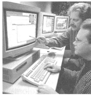
Technologieberatung im Open Migration Center

Mit Alpha AXP hat DEC eine 64-Bit-Risc-Architektur mit bisher unerreichten Leistungsdimensionen auf den Markt gebracht. In den neu geschaffenen Open Migration Centers (OMC) in Zürich, Bern und Lausanne bietet nun DEC umfassende Dienstleistungen an, um eine Migration auf die neue Alpha-AXP-Plattform zu ermöglichen. In Zusammenarbeit mit dem Kunden werden individuelle Lösungen zur Migration der bestehenden Software auf die