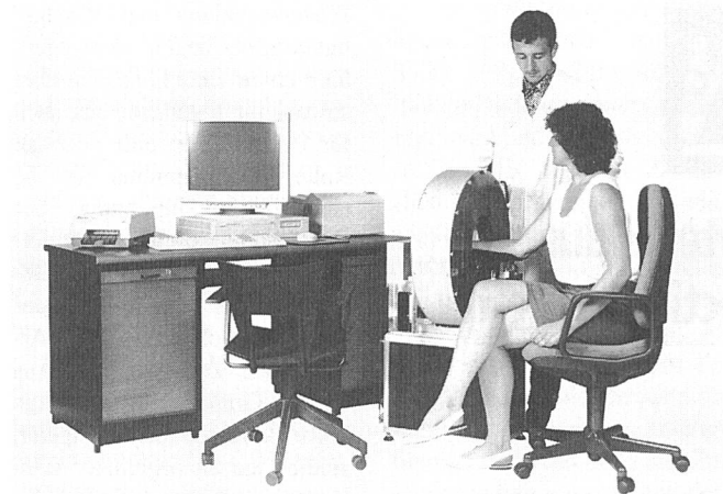
Früherkennung der Osteoporose und Therapiekontrolle mit Computertomographie

Grosse Fortschritte wurden beispielsweise erreicht in der Diagnose und der Therapie von Osteoporose, einer durch Knochenabbau und Mineralverlust bedingter Schwächung des Skeletts, welche häufig erst in einem späten Stadium, nach einem Knochenbruch oder bei näherer Abklärung von Schmerzzuständen im Bereich der Wirbelsäule entdeckt wird. Herkömmliche bildgebende Verfahren oder Röntgenuntersuchungen erlauben keine frühzeitige Diagnose des Knochenabbaus. Eine rechtzeitige, durch vorbeugende Massnahmen ermöglichende Erkennung bedingt den Einsatz spezieller, hochempfindlicher Messverfahren. Im Rahmen der NFP 18-Forschungsarbeiten ist am Institut für Biomedizinische Technik und Medizinische Informatik der Universität und der