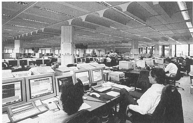
Nicht sichtbar und doch wichtig: LAN-Com-Verkabelung bei der SKA

tumsdaten (+30%) der Tochter LAN-Com, Littau, welche dieses Jahr umsatzmässig erstmals den Kabelfernsehbereich hinter sich gelassen hat. LAN-Com betätigt sich in den Bereichen Planung, Installation, Engineering, Unterhalt und Beratung von lokalen Netzwerken (LAN), bietet Netzwerkkomponenten (Hubs von Lanmet) sowie PC-Karten und Routers an und vertreibt auch Netzbetriebs-Software, Emulationen, Treiber sowie Netz-Management-Systeme. Bau