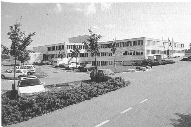
Neubau der Lanz AG, Oensingen

Nanometerabmessungen (Millionstelmillimeter) aufweisen. Im Bereich dieser winzigen Dimensionen beginnen Aspekte der Festkörperphysik, der Bio- und Grenzflächenchemie und der Materialwissenschaften zu überlappen. Und dies sind Gebiete, die am PSI etabliert sind. Weitere Vorteile bringt der Standort PSI durch die hier verfügbaren Neutronenstrahlen (SINQ) und – falls die Synchrotron-Lichtquelle Schweiz realisiert wird (siehe Forum) – Synchrotronstrahlen. Die SLS würde einzigartige Möglichkeiten für die photolithografische Herstellung von Nanostrukturen eröffnen.