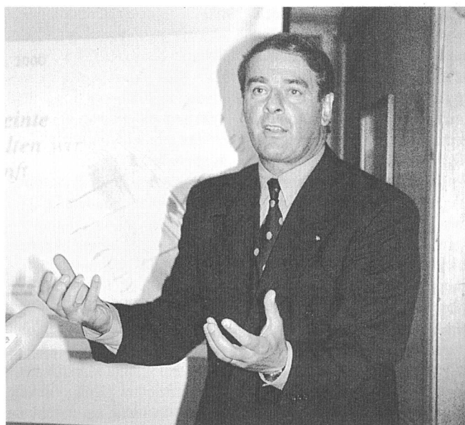
Bundesrat Adolf Ogi an der Präsentation des 3. Jahresberichts «Energie 2000» in Bern: «Und es bewegt sich doch!»