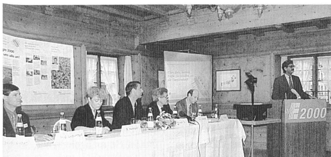
Vertreter der Aktionsgruppen von «Energie 2000» an der Pressekonferenz

Bundespräsident Ogi bezeichnete das Aktionsprogramm als Chance für die Schweiz. Das Programm hilft wesentlich mit, die Umwelt zu schützen. Es bildet den schweizerischen Beitrag zur Lösung des globalen Klimaproblems. «Energie 2000» sichert die Energieversorgung und schafft Arbeitsplätze in zukunfts-trächtigen Bereichen. Bereits ist die Schweiz weltweit führend, beispielsweise auf dem Gebiet leichter Elektromobile.