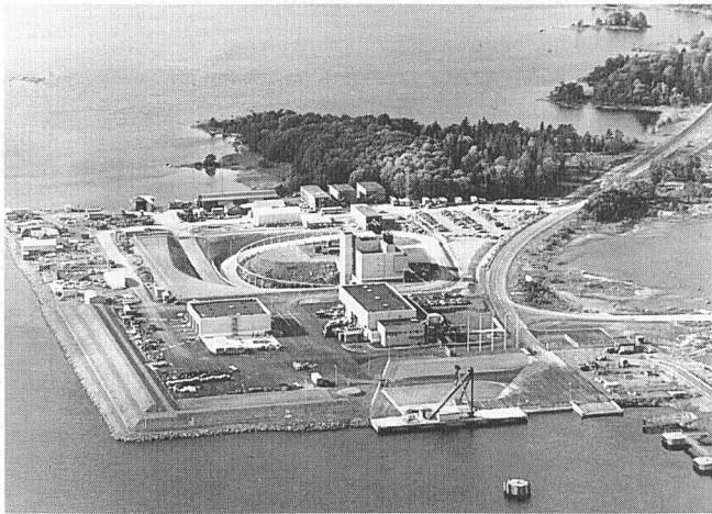
In Schweden schon seit langem Realität: Oberflächenanlagen des Endlagers für schwach- und mittelaktive Abfälle bei Forsmark

(vera) «Die Endlagerung radioaktiver Abfälle als Folge gewisser Formen von Energiegewinnung ist unter den heutigen Rahmenbedingungen unum-