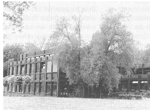
Das neue Microswiss-Zentrum in den Räumen der Ingenieurschule ITR in Rapperswil

Seit kurzem hat das Microswiss-Zentrum Nord-Ost seine Tätigkeit an der Ingenieurschule des Interkantonalen Technikums Rapperswil aufgenommen. Mit einer Fachtagung in Zusammenarbeit mit dem Institut für Technologiemanagement der Hochschule St. Gallen zum Thema «Mikroelektronik für Innovationen nutzen» stellt es sich am 25. Oktober 1993 erstmals einer