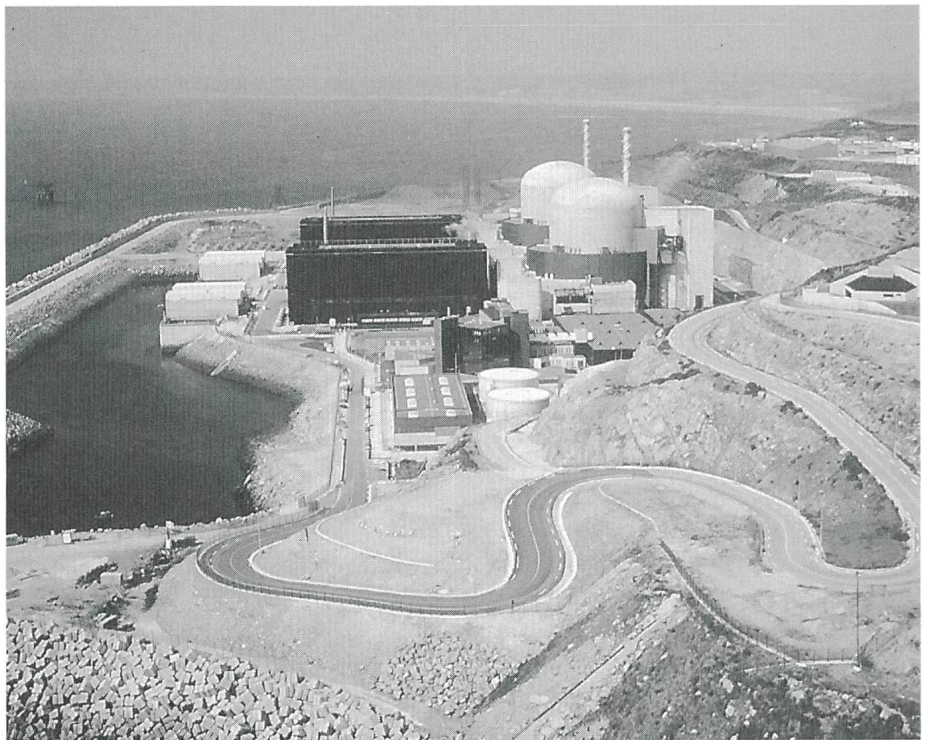
Bild 3 Kernkraftwerk Flamenville, Normandie: 2 Blöcke mit insgesamt 2660 MW

Auf diesem Gebiet ist die Logik festzustellen, dass die Länder mit anderen Energieressourcen als Uran versucht sind, eine «weiche» Haltung einzunehmen. Im Gegensatz dazu weisen die an Energieressourcen armen