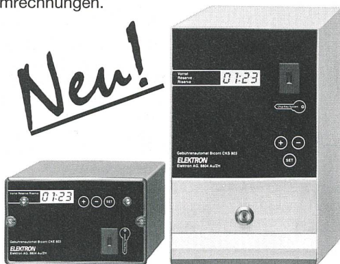
Neu: Bicont 803 – die bargeldlosen Gebührenautomaten

Exklusiv für Elektrizitätswerke: der EW-key zum Einziehen fälliger Stromrechnungen.