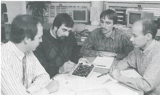
Kein Abbau sondern Ausbau bei Siemens Albis-F+E

und hegen zufällig die Absicht, in die Informatikbranche einzusteigen. Dann müssen Sie gewärtigen, dass Sie auf höchst bundesrichterlichen Entscheid hin Ihren Namen ändern müssen. Es könnte ja sein, dass die IBA AG in Bolligen sich durch das «iba» in Ihrem Namen genauso gestört fühlt, wie durch das «Iba» im Namen der Churer Informatik-Firma Ibacom. Seit 1988 lagen sich die Iba AG und die Ibacom AG wegen der Silbe «Iba» in den Haaren. Nachdem die Ibacom von den kantonalen Instanzen geschützt wurde, hat nun das Bundesgericht überraschenderweise anders entschieden. Die Churer müssen für ihr Unternehmen einen neuen Namen suchen. Der hartnäckige