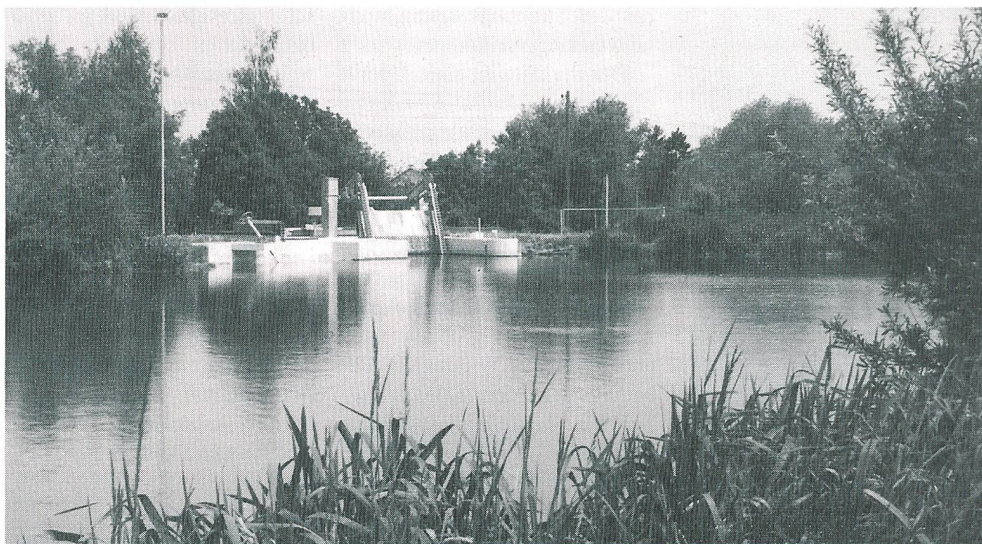
An der Tagung wird unter anderem das Kleinwasserkraftwerk Murg des Elektrizitäts- und Wasserwerks Sirnach besichtigt werden können. Es verfügt über eine Leistung von 125 kW und nutzt das Wasser eines Weihers. Es dient der Produktion von Spitzenenergie und gilt gleichzeitig als Notstromquelle für ein Pumpwerk der Wasserversorgung in der Region

(Zu) Die Schweiz besitzt ein beachtliches Potential an Wasserkraft im Bereich der Anlageleistung bis 300 kW. Die Förderprogramme des Bundes «Pacer» und «Diane» unterstützen eine sinnvolle Nutzung der erneuerbaren Kleinwasserkraft und organisieren nun zusammen mit dem Interessenverband Schweizerischer Kleinkraftwerk-Besitzer 1994 eine Fachtagung zum Thema Erneuerung von Kleinwasserkraftwerken (KWKW). Die Tagung, die am 18. Mai 1994 in Sirnach TG stattfindet, soll Entscheidungshilfen zur Erneuerung von