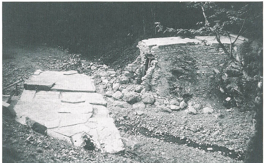
Bild 11 Restaurierte Überreste, Blick auf das linke Widerlager (1983)