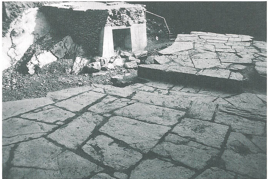
Bild 10 Restaurierte Überreste, Blick auf das rechte Widerlager (1983)

Nachdem Niklaus Schnitter bei einer örtlichen Begehung die früher geäusserten und schon erwähnten Feststellungen erhärtete, war dies der Funke, der dem neuen Willen zur Restaurierung den Durchbruch verlieh. So konstituierte sich 1981, initiiert durch das Schweizerische Salzmuseum in Aigle, eine dafür verantwortliche Ad-hoc-Kommission. Die notwendigen Studien wurden im Einvernehmen mit dem kantonalen Denkmalpfleger unternommen und von einem lokalen Ingenieurbureau gratis durchgeführt.