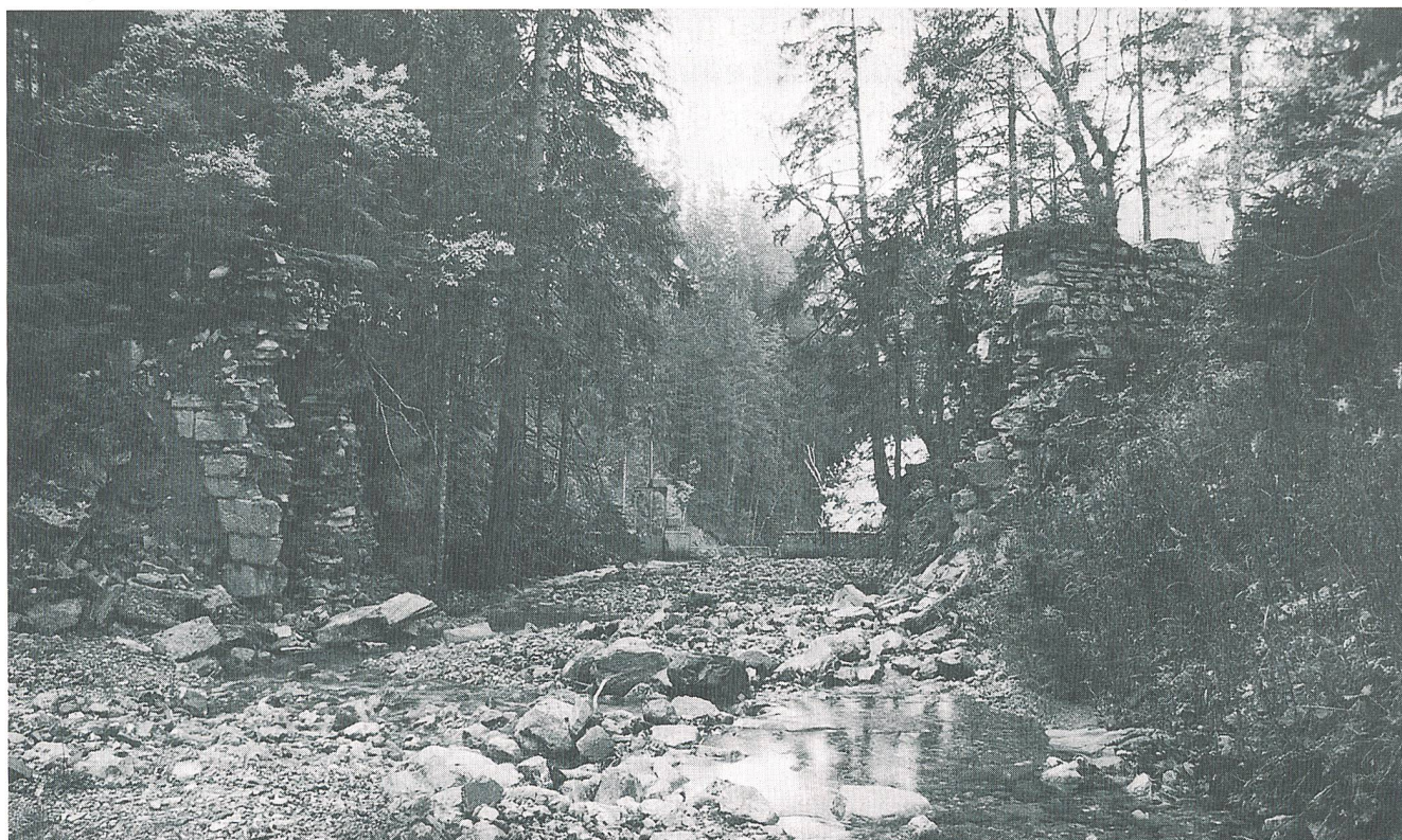
Bild 8 Zustand vor der Restaurierung