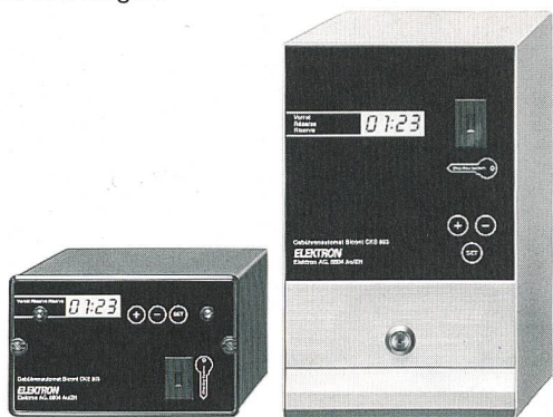
Bicont 803 – die bargeldlosen Gebührenautomaten

Exklusiv für Elektrizitätswerke: der EW-key zum Einziehen fälliger Stromrechnungen.