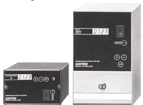
Bicont 803 – die bargeldlosen Gebührenautomaten

Exklusiv für Elektrizitätswerke: der EW-key zum Einziehen fälliger Stromrechnungen.