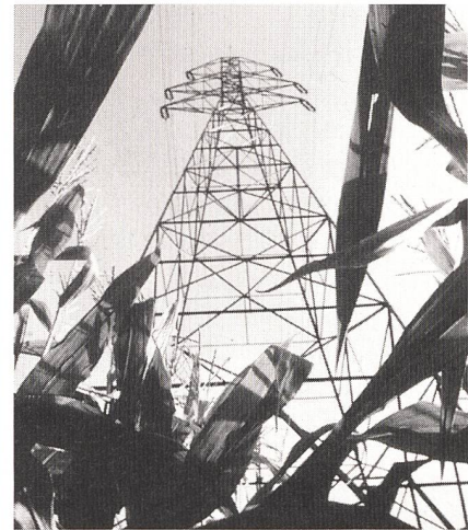
Titelbild: Energie aus Natur und Physik: Strommast im Maisfeld.

Bulletin SEV/VSE 8/1995 Zürich, 13. April 1995 86. Jahrgang