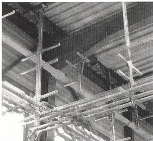
Das modulare Schienenmontage- und Befestigungssystem Multifix

Das System besteht aus mehreren Profilschientypen, Deckenstützen, Konsolen, Kopf- und Montageplatten und einer Palette von Zubehörmaterial. Das ganze Produktesortiment wird in galvanisch verzinkter und feuerverzinkter Ausführung und ausserdem noch rostfrei geliefert. Die statischen Berechnungen des Planers werden erleichtert und abgesichert durch eine umfassende Sammlung von Belastungsdiagrammen, aus welchen die wichtigen Daten ersichtlich sind. Diese werden den Anwendern abgegeben. Generell bietet Multifix den Vorteil, dass mit kleinerem Material- und Montageaufwand als bei konventionellen Systemen gearbeitet werden kann. Weitere Vorteile sind die grosse Flexibilität bei der Planung und