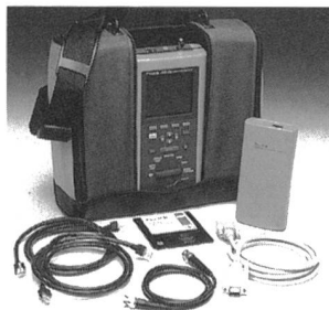
Fluke DSP-100 LAN Cable Meter

Speziell wenn im gemessenen Link Impedanzfehler oder die geforderten Next-Neben-