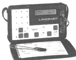
Portabler Multi-Kalibrator TRX

Das Instrument ist leicht bedienbar, da alle Funktionen über ein Menü angewählt werden. Ein- und Ausgangsgrößen werden deutlich und unmissverständlich angezeigt. Bis zu sechs oft benutzte Funktionen können vorprogrammiert und verschiedenen Tasten zugeordnet werden. Die Simulations-Ausgabesignale können manuell in zwei Geschwindigkeiten rampenförmig auf- oder abwärts gefahren werden. Für dynamische Tests im Automatikbetrieb erfolgt die Ausgabe pro-