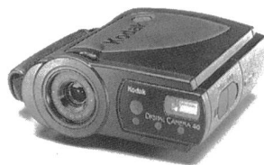
Westentaschentauglich: Kodak DC 40

Der neue ADPCM-Sprachprozessor MSM 6688 ist für eine dynamische 32-MBit-Speicher-Schnittstelle ausgelegt und unterstützt Aufnahmezeiten von bis zu 35 Minuten. Ein 12-Bit-A/D-Wandler und ein 12-Bit-D/A-Wandler sowie der integrierte Tiefpassfilter (-40 dB/Oktave) sorgen für eine ausgezeichnete Sprachqualität mit Bitraten von 12 bis 64 kBit/s. Diese sind mit Abtastfrequenzen von 4,0 bis 16 kHz definiert. Für die Speicherung eingehender Mitteilungen können in Kombination mit einem Interface-LSI, dem MSM6791, dynamische RAM-Chips mit Kapazitäten von 1, 4 und 16 MBit eingesetzt werden. Wahlweise bieten sich die seriellen Sprachregister von OKI an, die ohne Interface auskommen. Ausserdem können Sprach-ROM mit bis zu 4 MBit für feste Ansagetexte, wie beispielsweise die Zeitangabe, angeschlossen werden. Der Prozessor bietet 64 Auf-