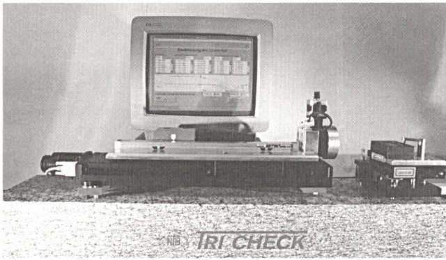
Prüfstand für Lasertriangulationssensoren

wendern von LTS ein Instrument zur Verfügung, mit welchem effektiv, objektiv und normenkonform Leistungsparameter von LTS ermittelt und dokumentiert werden können. Der Prüfstand ist für LTS bis zu einem maximalen Arbeitsabstand von 350 mm ausgelegt. Mit ihm können Linearitätsabweichungen, die Auflösung, die Wiederholpräzision sowie die aufgabenspezifische Messunsicherheit der Sensoren bestimmt werden. Ferner lässt sich der Einfluss verschiedener Oberflächentexturen auf die Messergebnisse feststellen, so dass entsprechende Korrekturkennlinien berechnet werden können. Weitere Informationen erteilt: NTB, Interstaatliche Ingenieurschule Neu-Technikum Buchs, Labor für Qualitäts- und Fertigungsmesstechnik, Werdenbergstr. 4, 9471 Buchs SG, Telefon 081 755 33 58, Fax 081 756 54 34, E-Mail halter@ntb.ch.